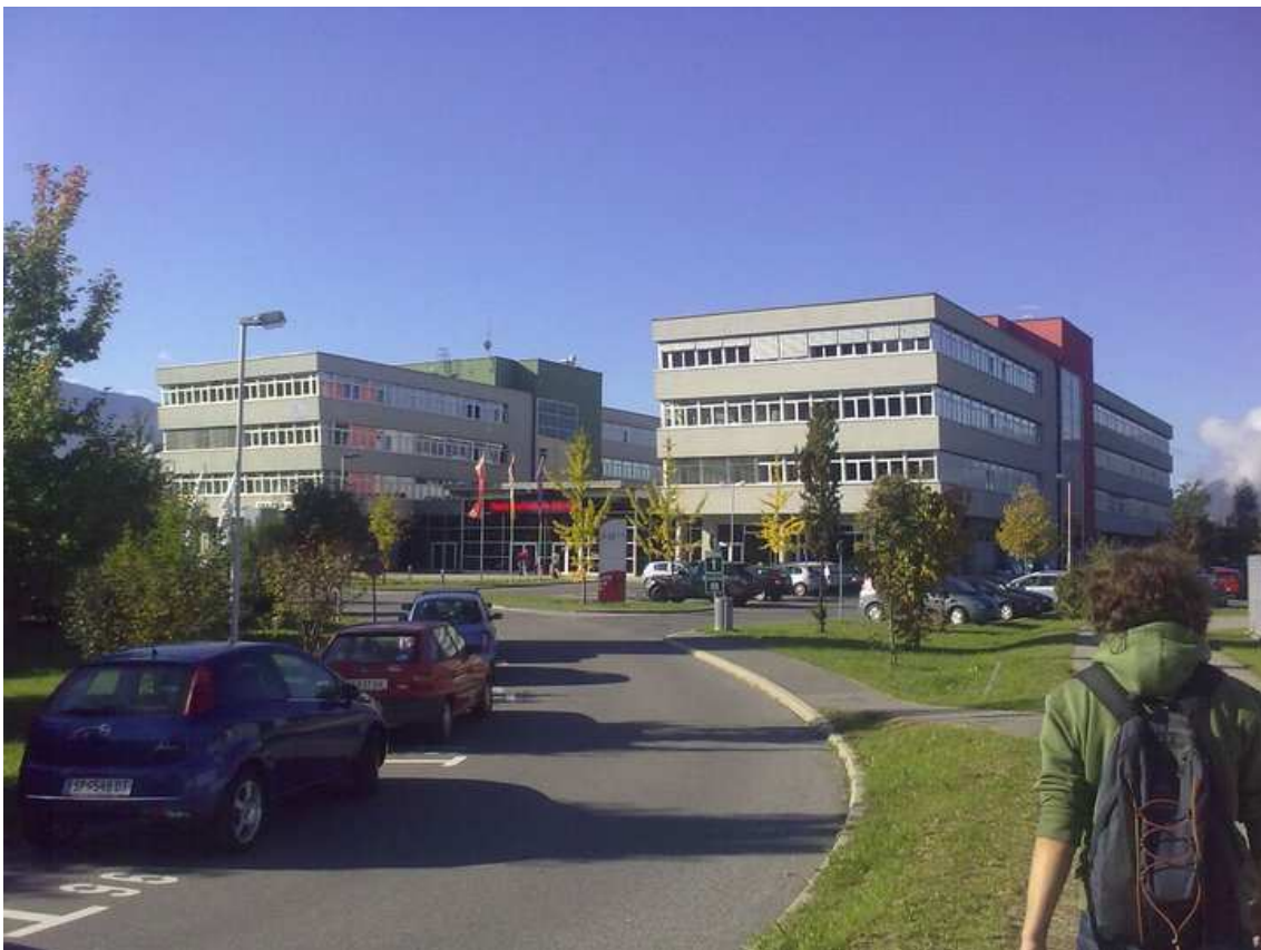
La universitat. (Setembre)