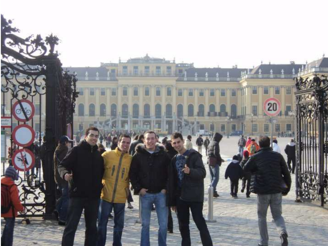
Jo amb uns col·legues quan vam anar a Viena. (Desembre)