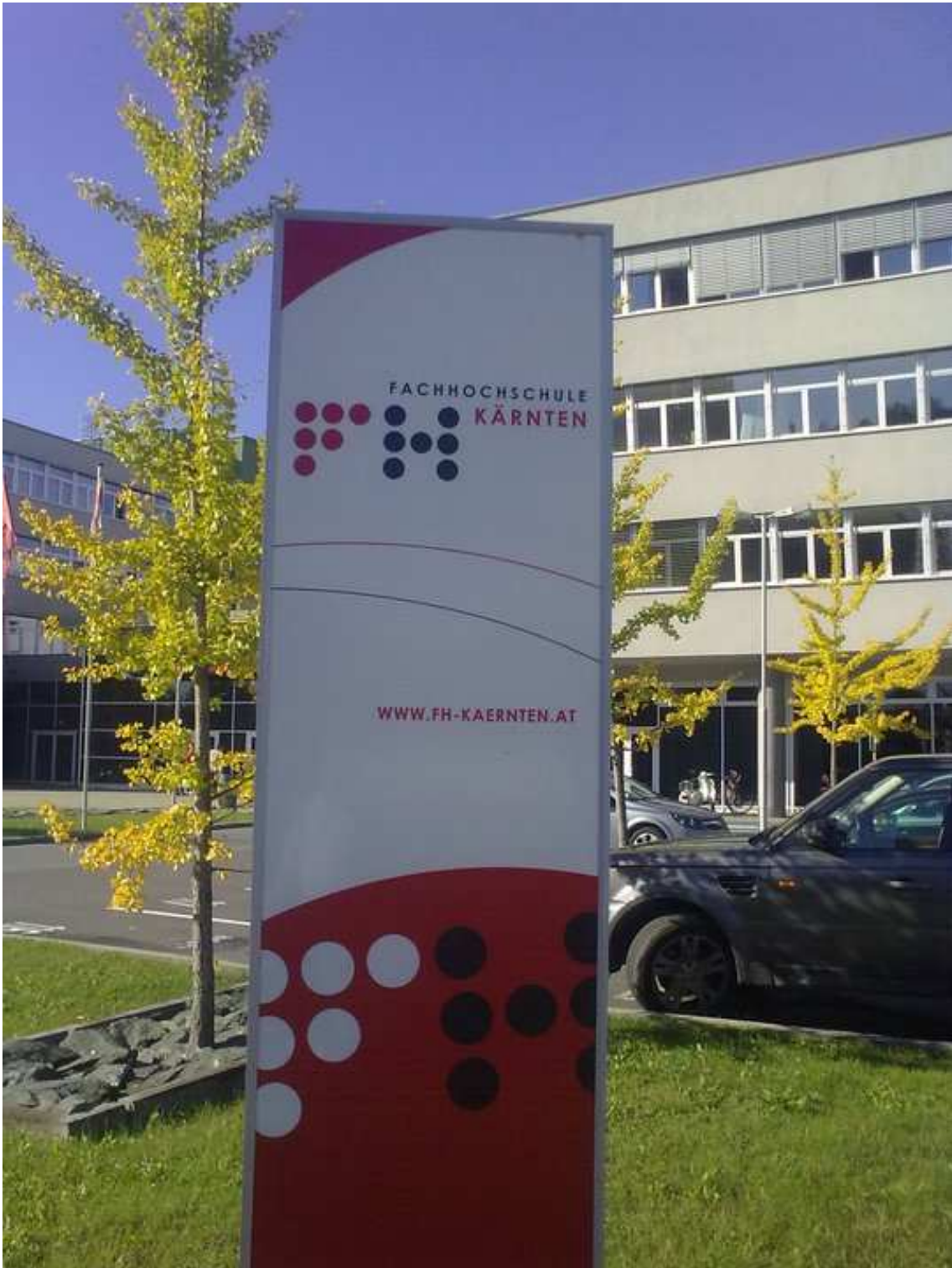
Fachhochschule Kärnten. La universitat és molt nova i acollidora.