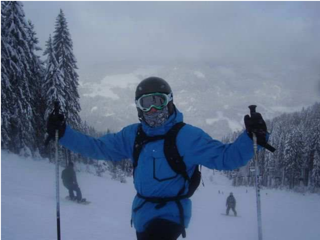
Gerlitzzen. Ski-resort a Villach. 10 minuts de casa!!!Incredible!