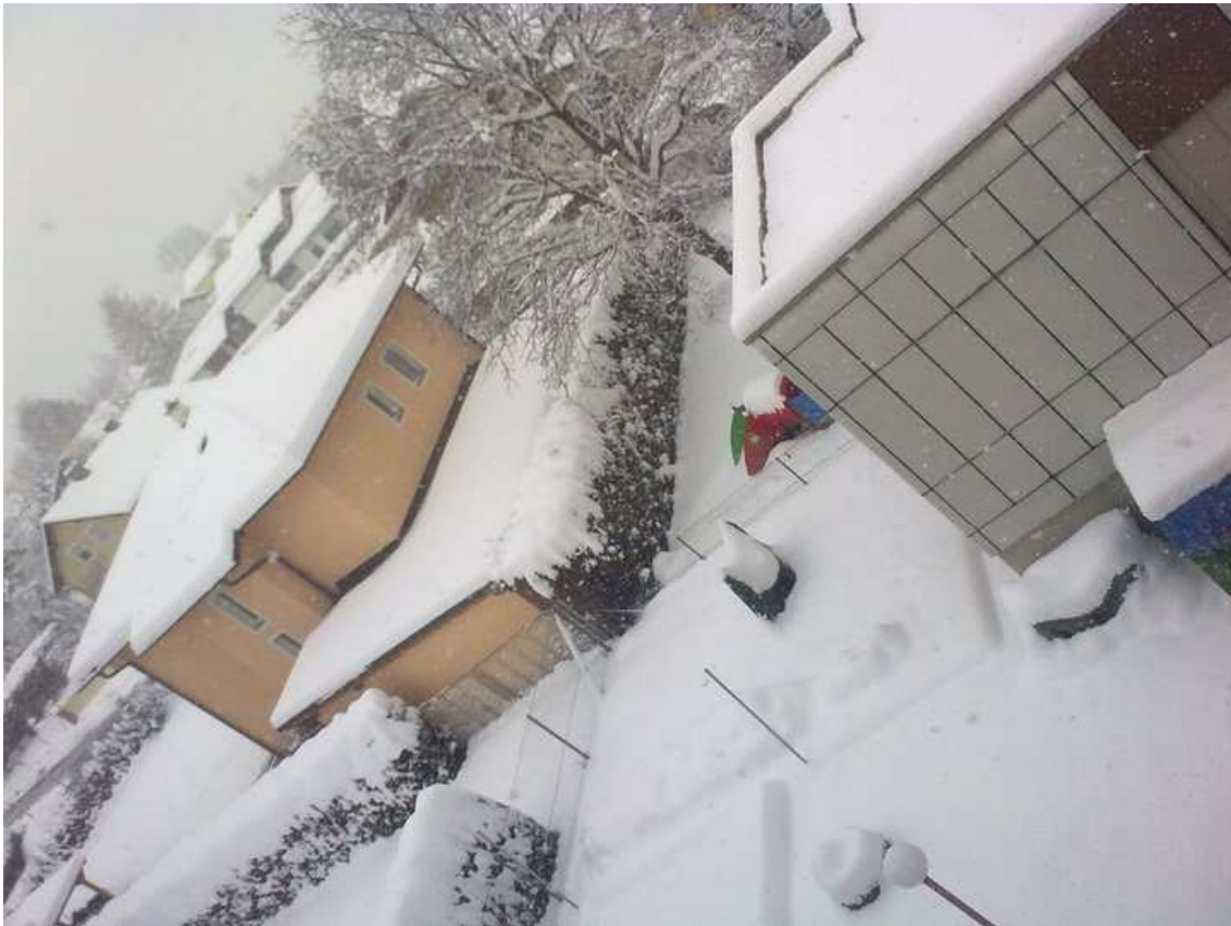
Vistes des de la meva habitació, mitjans de Gener .