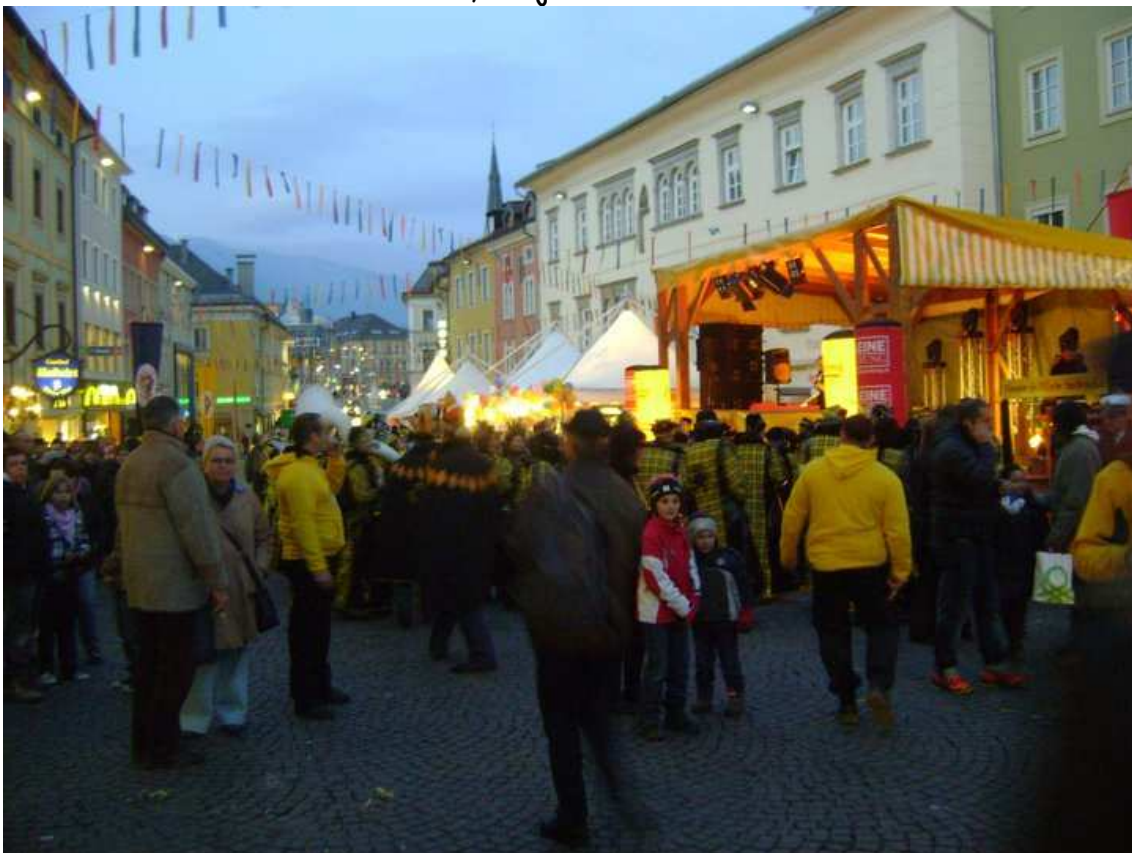
Carrer principal de Villach durant el carnaval (el més important de la zona).