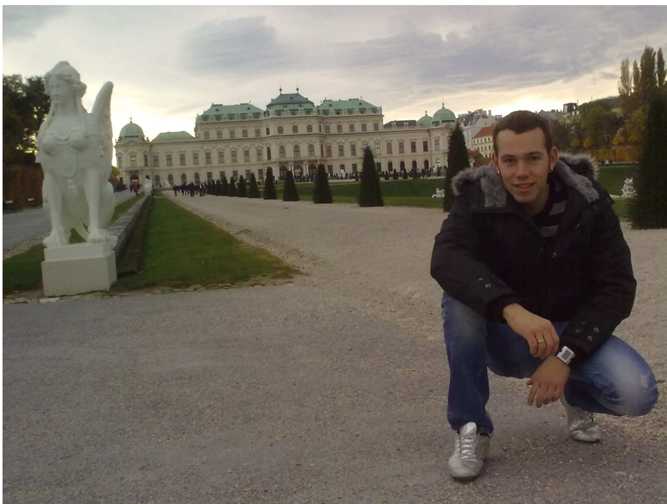
Palau de Schönbrunn, Vienna. Setembre 2011, encara faltava arribar el gelat hivern.

Tot seguit us envio 4 fotos per que os feu una idea, si voleu més informació ja us la donaré de primera ma.